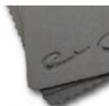
detail vlnitého lemu a průřezu (pouze u 0,35 mm)